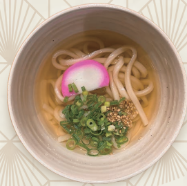
ミニうどん・そば 380円