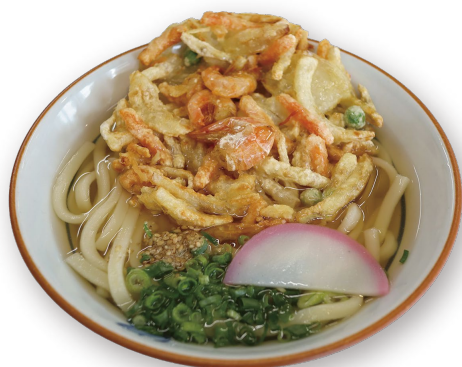
かき揚げうどん 800円