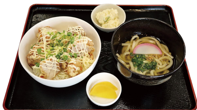
唐揚げ丼セット 970円