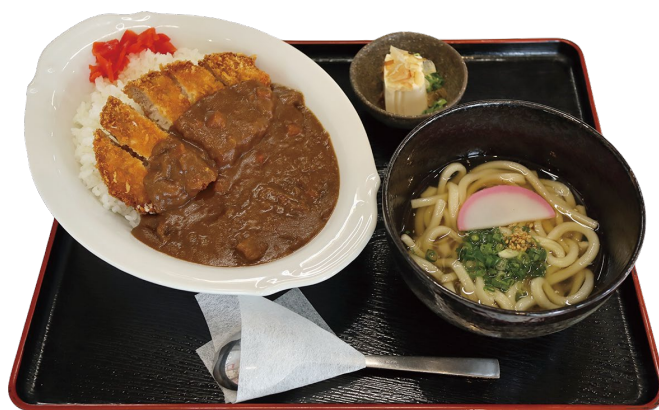
カツカレーセット 1170円