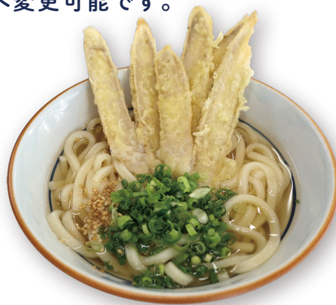
ごぼう天うどん 680円