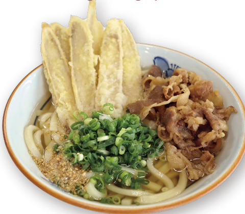
ごぼう天肉うどん 1040円

※ご注文の商品により、ご提供の順番が他のお客様と前後する場合がございます。予めご了承ください。